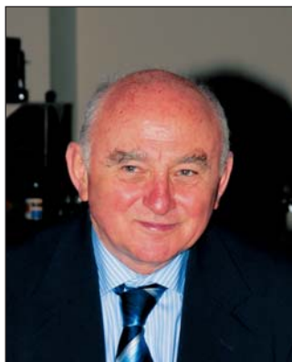
▲▼ Glatz Ferenc új könyvében cselekvési programjavaslatokat is olvashatunk a vidék átalakulásának segítésére

Tavaly év végén megalakult a Magyar Nemzeti Vidéki Hálózat. Elnökének Glatz Ferencet választották. A döntés lehet, hogy sokaknak meglepő, akik azonban ismerik az akadémikus ez irányú tevékenységét, azoknak éppenséggel magától értetődő. A szervezet létrejöttéről, szervezeti felépítéséről már beszámoltunk. Azóta az elnök véleményét személyesen is megismerhettük.