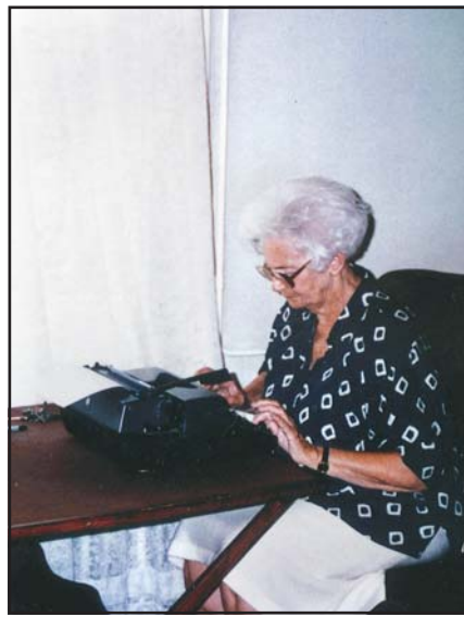
„Napi többórás konzultációival, telefonbeszélgetéseivel, kiterjedt levelezésével segíti, hogy az emberi mozzanatok ne süllyedjenek az informalitásba, hanem beszéljünk arról nyíltan.”

ge elvész a történeti elemzés során is. Jelentéktelen múlt- és jelenalakító tényezőnek tűnnek az emberi jellemek, az érzelmek. Vagy éppen a személyes törekvések. Elvész szemünk elől, hogy az automatizmusokra épülő gépsorok, ezen gyors technikai környezetfejlődés mögött milliárdnyi egyéni feltalálói ötlet, emberi alkotóvágy rejlik.