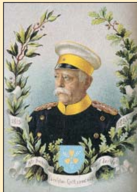
Otto von Bismarck, a „vaskancellár”

1883-ban törvényt hoztak a betegbiztosításról, amelyben kötelező jelleggel előírták az évi 2000 márka alatti jövedelemmel rendelkező ipari munkások és alkalmazottak betegbiztosítását. Ezt később a közlekedési és a mezőgazdasági dolgozókra is kiterjesztették. 1884-ben ezt a rendszert kiegészítették a fentiekre vonatkozó teljes körű balesetbiztosítással is. Az 1889-ben bevezetett rokkantsági és öregségi biztosítás tette teljessé a társadalombiztosítás rendszert, amelyet ezután nem kötöttek jövedelemszinthez sem. A terheket az állam, a munkáltató és a munkavállaló közösen viselte. Mindezzel Németország a világon elsőként vezetett be egy átfogó, kötelező társadalombiztosítási rendszert.