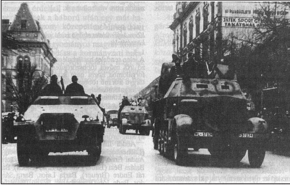
Német katonai teherautók Budapest, 1944. március