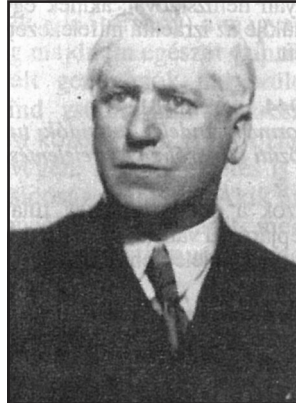
Bajcsy-Zsilinszky: a parlamenti ellenzék, a baloldali illegálisban