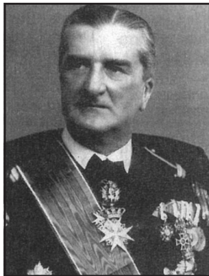
Horthy, aki kitarthatott a főhatalom élén, s akít a németek zsaroltak