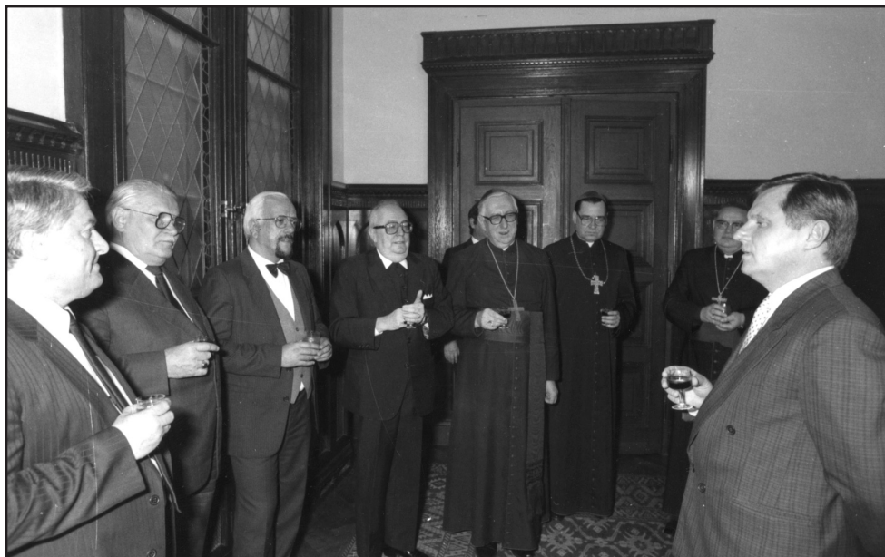
Németh Miklós miniszterelnök munkaabéden látja vendégül a magyar egyházak és felekezetek vezetőit. 1990. április 18.

Támadhatnak majd félelmek az átadott iskolák tanári karában is. Az egyház feltehetően nem vesz át mindenkit, így összeszokott tanári karoknak kellene felbomlaniuk. Már most szeretném óvni az egyházakat a szélsőségektől. Ne ragaszkodjanak ebben a dogmákhoz és az ellendogmákhoz. Ne zárkózzanak el attól, hogy ahol a tanács megértő, a visszakapott iskolában vállalják – szerződésileg kötelezve magukat –, hogy az ateista követelmények szerint is ellátják a helyi beiskolázási igényeket. Miért ne lehetne egy iskolaépületben hívők és nem hívők osztálya? A tanári kar is