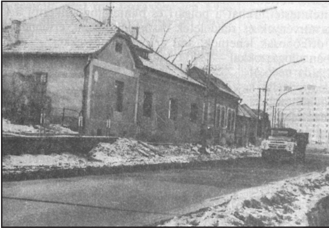
Amit a közönség látott: Városkorszerűsítési program. Fénykép, Ózd, 1960