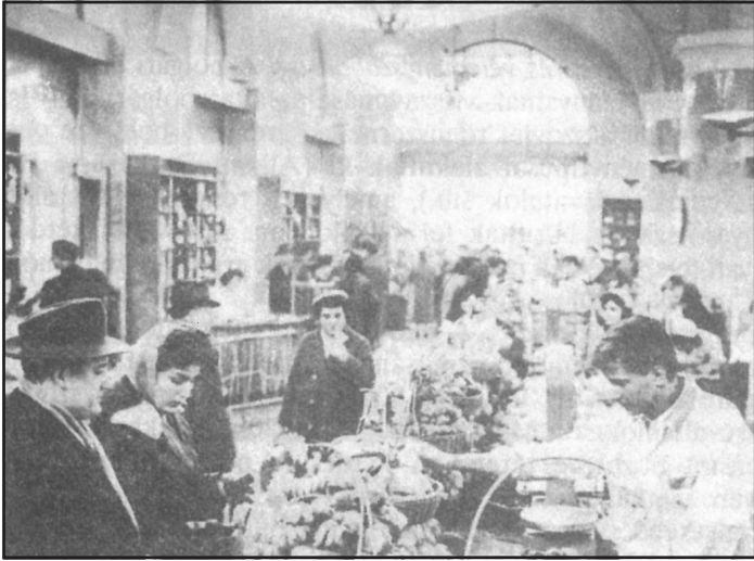
Amit a közönség látott: Karácsony előtti árukínálat. Lenin körút és Wesselényi utca sarok. Fénykép, 1960