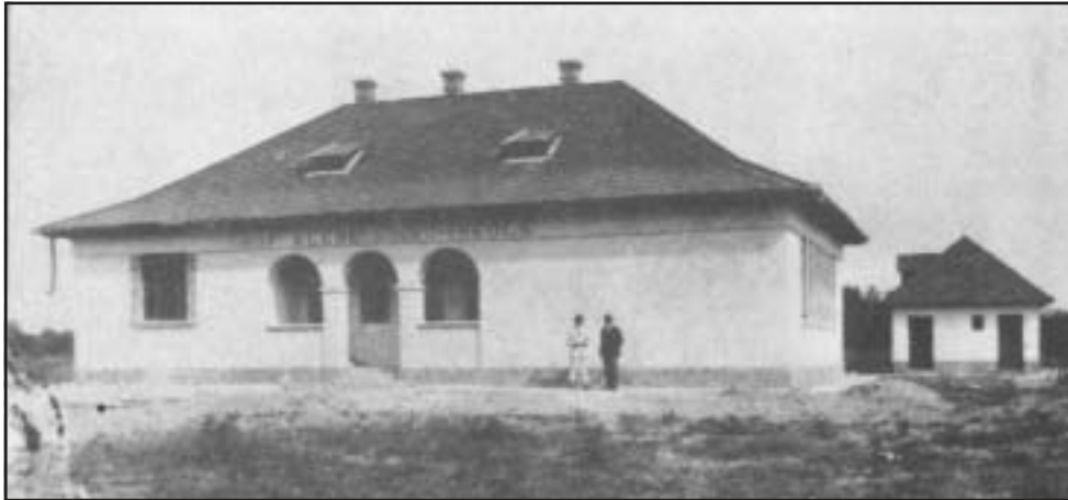
Klebelsberg-iskola, Domaszék, Csongrád vm. Fénykép

Az új kultuszminiszter, gr. Klebelsberg Kunó pontosan látja, hogy egy ország munkaerejének képzettségétől függ az ország termelőképesége. Már az 1910-es években többször megfogalmazódik Tisza István miniszterelnök környezetéből az az elgondolás, hogy a magyar munkaerőt – így a munkást és a parasztot is – azért kell megfelelően iskolázni, hogy jobb termékeket állítsanak elő az üzemekben és a földeken. Most, 1919 után a kulturális program középpontjába mégis a középosztályok kerülnek először. Az új államberendezkedés azon múlik, vajon meg tudják-e oldani a magyar középosztályok rendszeres képzését és rendszeres foglalkoztatását. És meg tudják-e oldani azt, hogy színvonalában elérje a nyugat-európaiakat. A művelt középosztály a nemzet vezető ereje – szegezik szembe e tételt a forradalommal, amelyik a társadalom vezető erejeként a munkásosztályt jelölte meg. 1922–1926 között megszervezik az ország tudományos, egységes intézményrendszerét, állami dotációban részesítik az Akadémiát, egységes szervezetbe vonják a múzeumokat, a levéltárakat, az 1910-es években megkezdett egyetemi építkezéseket gyors ütemben folytatják Debrecenben, Szegeden, Pécsen. Ugyanakkor 1924–26 között újabb középiskolai törvé-