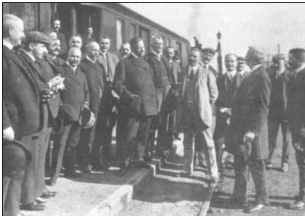
A székely körvasút megnyitása. Fénykép, 1909. október

Németországban a régi, szétszabdalt német fejedelemségek bürokráciája és a hagyományos kézműiparosság soraiból került ki az új állami és magántisztviselői garnitúra.