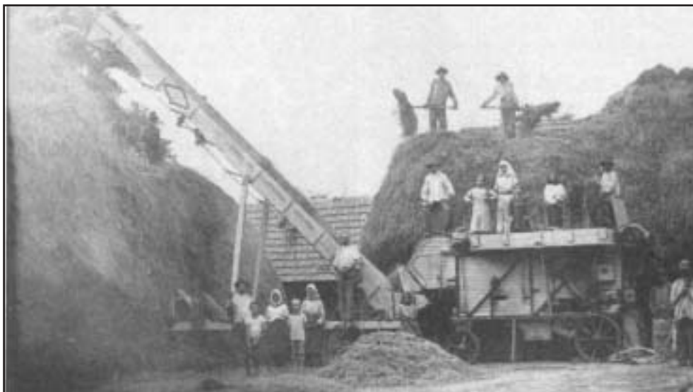
Cséplés Zsombolyán. Fénykép, 1910 körül

A másik reformelképzelés Magyarországot mint agrárállamot kívánta fejleszteni. Darányi Ignác, aki az 1890-es évektől