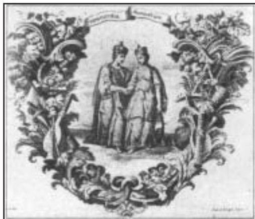
Magyarország és Ausztria allegorikus ábrázolása, 1835

tó hatalmi tényező: a központi hatalom – az uralkodóé – és a rendi hatalom – a kiváltságosaké – változó egyensúlya, küzdelme, együttes működése döntötte el, hogy minek hogyan kell történnie. Az uralkodónak koronázásakor esküt kellett tennie az ország törvényeinek megtartására, hitlevelet kellett kiadnia és időszakonként országgyűléseket kellett összehívnia.