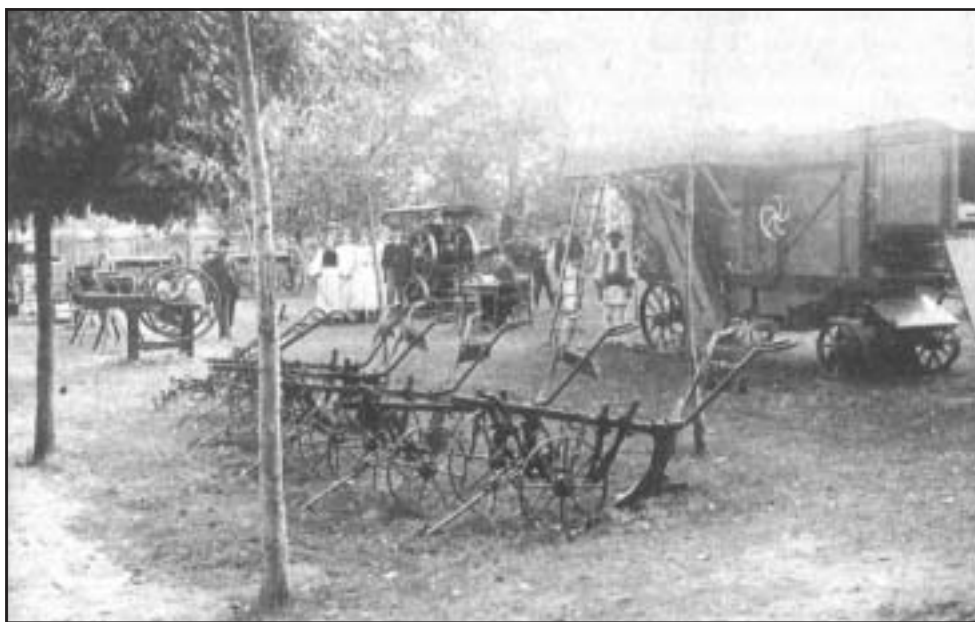
Mezőgazdasági gépek bemutatója. Fénykép, 1890-es évek

többször volt földművelésügyi miniszter, igen határozottan fogalmazza meg a magyarországi társadalom reformálásának tervét. Felfogásának alapja az, hogy Magyarországon a mezőgazdasági adottságokhoz kell az ipari fejlődést igazítani. Mind az ő, mind a köréje gyűlt gazdász, birtokos lobbynak két alapelgondolása van. A magyar mezőgazdaság technikai korszerűsítése a kiindulópont. Hatalmas propagandakampányt indítanak a modern ekék, a vetőgépek, majd az 1900-as években a traktorok érdekében. 1900 és 1914 között ennek eredményeként a magyar mezőgazdaság igaereje gyökeresen átalakult. A közép- és nagybirtok 70%-án az első világháború előtt már géppel vetnek és aratnak. A traktor nemcsak a szarvasmarhát és részben a lovat helyettesíti, hanem működteti a cséplőgépet is. 1915-ben a magyarországi gabona 90%-át már géppel csépezték. 1913-ban a magyarországi szántóföldi művelés terméshozama eléri Franciaország szintjét. Ugyanakkor a nagy filo-