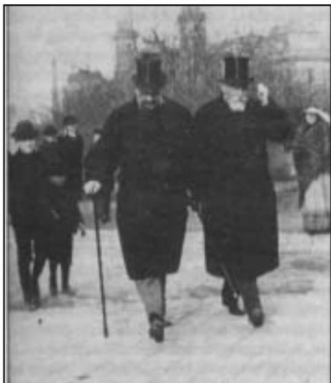
Széll Kálmán és Darányi Ignác. Budapest, 1910