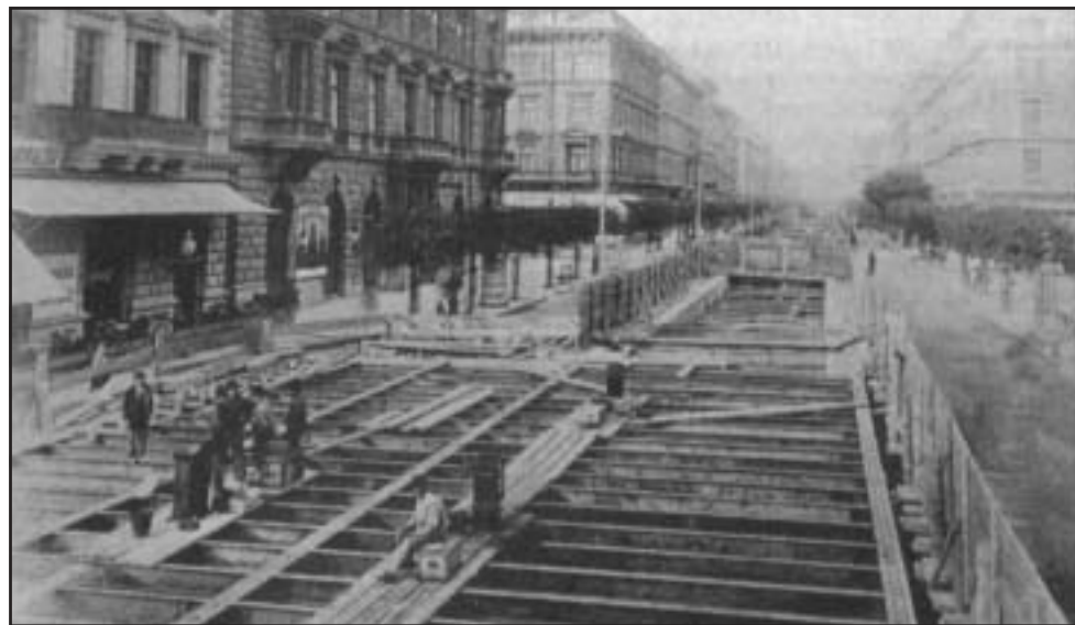
Az épülő budapesti millenniumi földalatti az Andrassy úton. Fénykép, 19. század vége

lesztését követeli, mégpedig a mindennapi élet technikai infrastruktúrájának, vasutaknak, szerszámoknak, gépeknek az alapját adó nehézipar fejlesztését. Elégedetten állapították meg az 1910-es években, hogy Magyarországon az iparon belül rövid 20 év alatt az élelmiszeripartól a vezetést átvette a nehézipar. Ennek az ipari és kereskedelmi átalakítást sürgető reformkoncepciónak a politikai ideológiában nem volt határozott exponense. A reformelképzeléseket részben a GYOSZ, részben a minisztériumi adminisztráció, részben pedig az 1910-es években a kormányzó Tisza-párt színvonalas publicisztikája, a Magyar Figyelő képviselte. Ez az ún. merkantil kötődésű tisztviselő-gazdász publicista csoport következetesen képviselte az ország egész területére kiterjedő technika- és ipartámogatást, és következetesen az ipart tartották annak az erőnek, amelyik az elmaradt magyar falu életmódját is átalakíthatja és a társadalom egészét, így a munkásságot és parasztságot is beemeli a kultúrába. Pontos elképzeléseket alakítottak ki az árutermelést és az államháztartást szabályozó adózásra, amely adótörvény kimondottan a középrétegeknek – a jól kereső szakmunkástól a városi kispolgárságig – kedvezett. Pontos elképzeléseket alakítottak ki az ország közigazgatási reformjára, szemben a vármegyével, ahol a vidéki dzsenti-nemesi társadalmi elemek voltak uralmon, ők a szakszerű centralizált kormányadminisztrációt kívánták fejleszteni. A hatalmat mind inkább a kormány által kinevezett