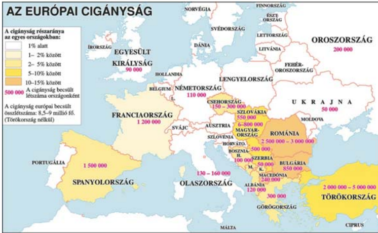
4. térkép A romák Európában

26+8 nemzet – az 1 millió létszámú nemzeti-etnikai közösségeket számítjuk ide – közül 26-nak van saját állama és 8 olyan nemzeti közösség – katalánok 10, romák 8–9, (4. térkép) okcitánok 2, arabok 5, flamand 6, török 6,5, orosz 1,5, pakisztáni 1,2 millió –, akiknek nincs még nemzetállamuk, vagy nemzetállamuk az EU határain kívül fekszik (mint a törököknek, araboknak, oroszoknak). A magyarok sajátos helyzetben vannak, mert tagállam ugyan a nemzetállamuk, de ők más államokban is élnek nemzeti kisebbségekként.