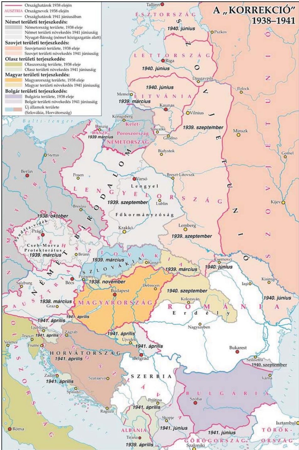
2. térkép – Az első korrekció, 1938-1941