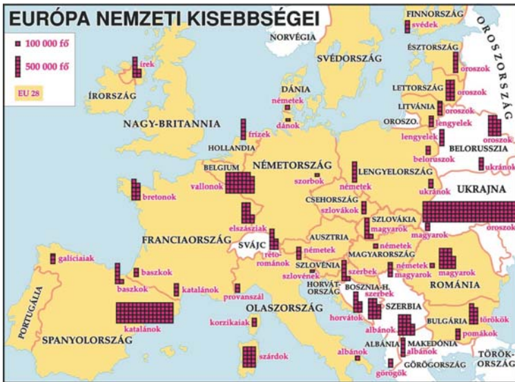
5. térkép Európai nemzeti kisebbségek

És ezek csak az ún. történelmi kisebbségek... De ne feledjük: ma már számolni kell a kisebbségek új típusával, az ún. migrációs kisebbségekkel , amelyeket az új népmozgás, korunk egyik legfeltűnőbb demográfiai jelensége hoz létre. (Bade 2002) (5. térkép) Azután már más kérdés: miként tudja az ún. nemzetállam kezelni a migrációs kisebbségek keltette szociális és kulturális feszültsé-