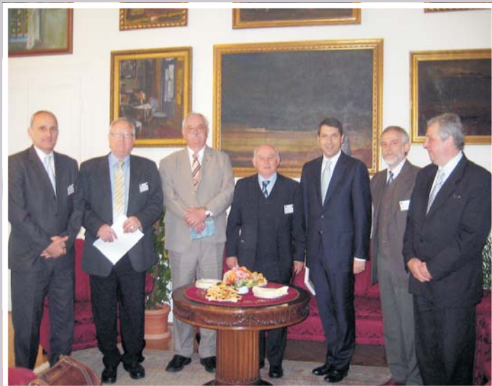
Az Elnökség az V. Országos Vidéki Fórum megkezdése előtt

Az elmúlt húsz év Magyarországa, a rendszerváltás Magyarországa nem tudott mit kezdeni a vidékkel, a vidéki mezőváros fogalmával. Az egyik megközelítés romantikus giccs volt. Ettől szeretném városom polgárait megóvni. Nem múltba hajló historizmus kell ma Magyarországon, és a jövő sem szólhat erről. A történelmi tanulságok levonására szükség van, de arra, hogy ez legyen a szervezőerő, a kötőszövet, attól óvni mindenkit. Miként attól is, hogy a vidékre – „üzemhatékonyági megközelí-