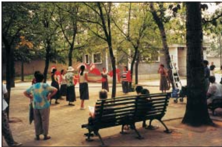
A hagyományos legyezőtánc a modern kínai testkultúra részévé vált. Peking, 2000

Kína ebből a szempontból sajátos világtörténelmi szerepet kap ma. Az