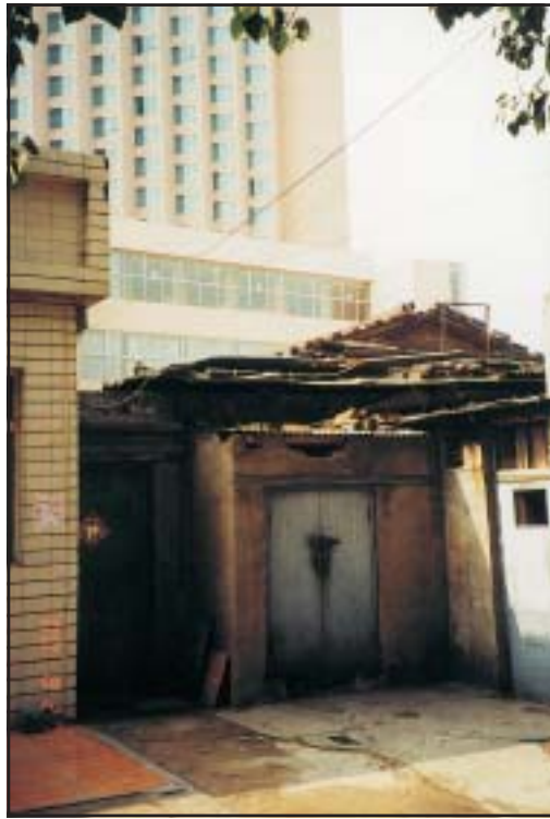
Lakásul szolgáló kalyiba a modern szálloda tövében. Peking, 2000

Ezért láttuk örömmel, hogy szűkebb hazánk, Magyarország milyen szoros kapcsolatokat épített ki már az 1970-es évek végén Kínával, és örömmel láttuk, hogy tágabb hazánk, Európa fokozatosan ismeri fel Kína világtörténelmi jelentőségét.