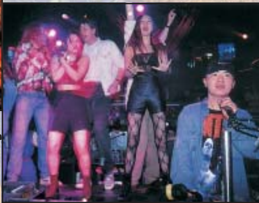
A párttörténet ma is tananyag – esténként viszont nyugati típusú diszkóklubban szórakozik a városi fiatalság. Peking, 1997