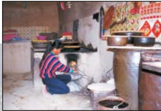
A népesség jelentős része ma még a fejletlenebb vidéken él. Sziklába vájt lakás, 2005