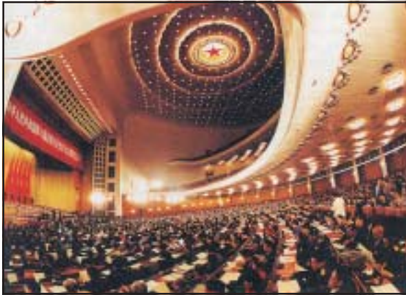
Kínában legkevesbé a politikai rendszer változott. A gazdaság nagy része már a piacgazdaság elvei szerint működik – autoritárius politikai irányítás mellett. A VIII. Országos Népi Gyűlés 4. ülésstaka, 1996. március