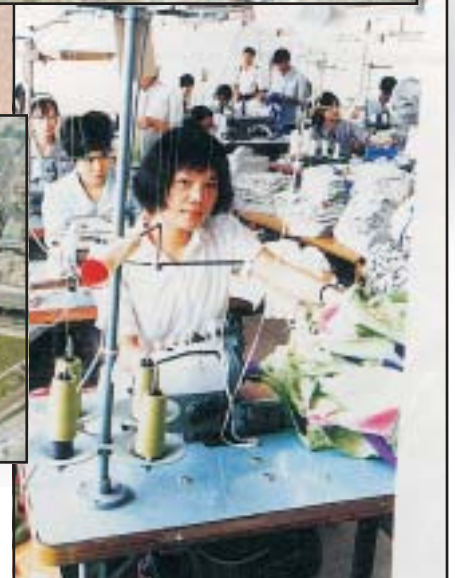
Az olcsó kínai textilárak napjainkban már világvetést támogatnak. Ruhagyár, 1990-es évek