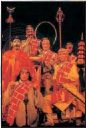
A 16. századi hagyományos kínai színházas napjainkban reneszánszát éli