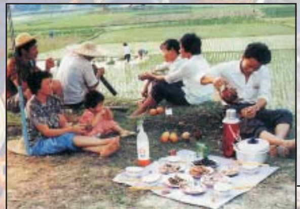
A mezőgazdaságban átfogó reformokat indítottak: rátértek a „családi felelősségi rendszerű” egyéni gazdálkodáshoz. Az eszközök kultúra alig változott. Rizsföldjén dolgozó parasztcsalád ebédel, 1990-es évek