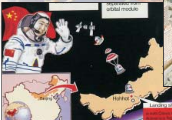
A globális hatalmi tényezővé váló Kína a világűr meghódításából is részt követel. Az első kínai űrhajós, 2003. október