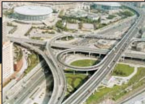
Az infrastrukturális fejlődés nyomán autópályák épülnek