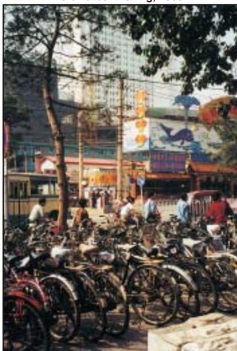
A kínai nagyvárosokat már autópályák kötik össze – de a kerékpár sem ment ki a divatból. Peking, 2000

A zsidó-keresztény kultúra és a görög-római politikai rendszer alapvető erkölcsi, etikai kérdései ezek. Jó volna, ha a történettudomány is feltenné magának azokat. Ilyen alapon tehetjük fel a kérdést: vajon miért tűrte például a liberális demokrácia a fasizmus kibonta-