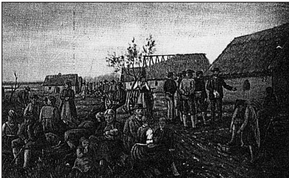
Svábok betelepülése. Olajfestmény részlete, 1906