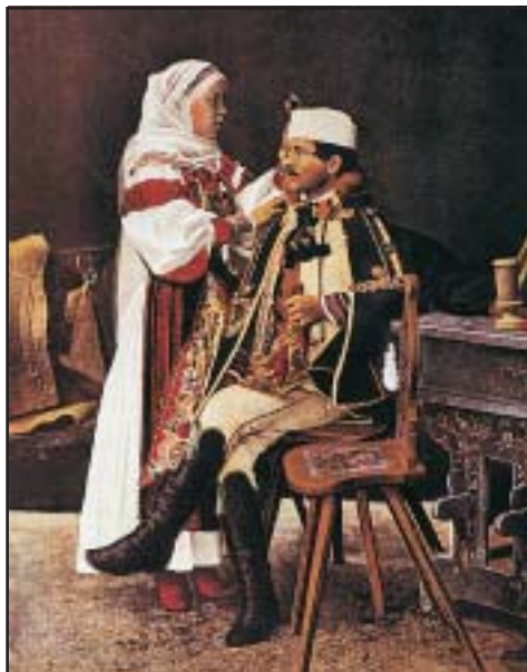
Magyar jegyespár. Színezett fénykép, 1910