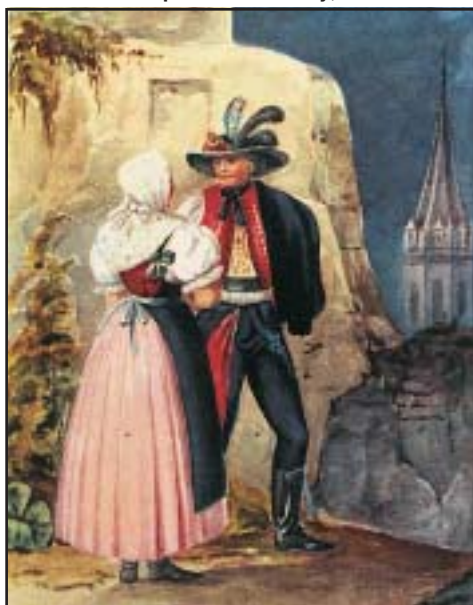
Horvát pár. Vízfestmény, 1840