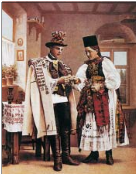
Szász jegyespár. Színezett fénykép, 1910