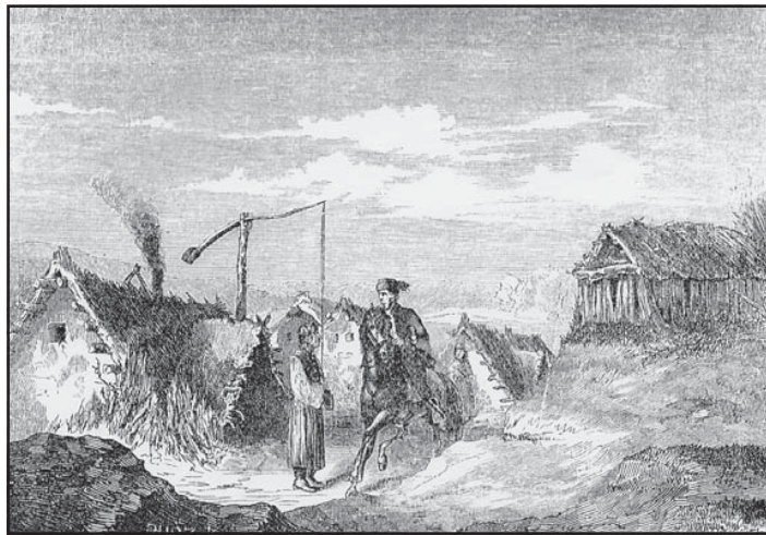
Dohányosok kunyhói a sóregi pusztán. Lüders rajza, 19. század

A radikális politikai mozgalmak azután a honszeretet e politikai-közéleti tartalmát mindenek elé helyezik: a polgári demokrácia, a kommunista, a nemzetiszocialista politikai intézményekhez kötődésüket az egyéb tartalmak ( szülőföld, a nemzet ) fölé emelik. (Különös belső őrlődéshez vezetett ezen sok szálon szövődő kötődés a honhoz az önként vállalt politikai emigrációkban: amikor a honi politikai rendszert az egyén annyira elviselhetetlennek tartja, hogy háttérbe szorítja a lokális természethez, nemzethez kötődést. Az őrlődés természetesen azokban is végbemegy, akik az adott politikai rendszert