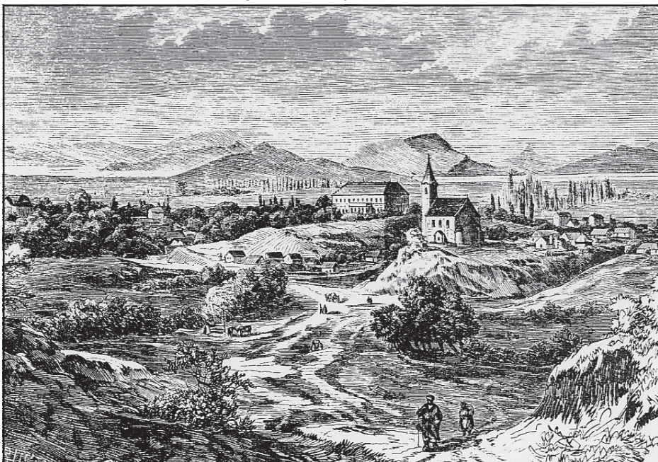
Lengyeltóti település a kastéllyal és a Fonyód hegygel. Greguss, János rajza, 19. század

Van, aki hangos felvonulásokon kiabálja a közösség egy részét vagy egészét összetartó jelszavakat. Van, aki magába zárkózik, ettől idegenkedve. Van, akinek szemébe könny szökik, ha hosszú távollét után újra találkozik gyermekkori játszótársaival, s van, aki önfelédten mosolyog. Nincsenek receptek, forgatókönyvek az emberi cselekvés módjának megítélésére.