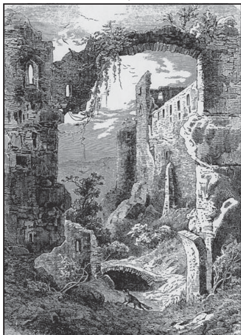
Csábrág várromjai. Keleti Gusztáv rajza, 19. század

kisvadjaival, s a szemhatárt koronázó hegyvonulatok, amelyek közé naponta többször törnek be gomolygó, szürke, majd báránnyefehér felhők, átfestve a völgyek, hegytetők színeit.