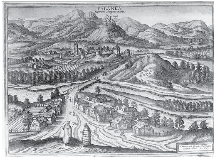
Drégelypalánk látképe. Színezett rézkarc, 1617

Ez év áprilisában könyvsorozat indult „Magyar tudománytár” címmel. A sorozat hét kötetben tárgyalja Magyarország és a magyarság szállásterületének földtani viszonyait, a növény- és állatvilágot, a települési viszonyokat, társadalmi állapotokat, gazdálkodást, az igazgatási-politikai intézményeket, a történelmi hagyományegyüttest és a mai kulturális viszonyokat és azok intézményeit.