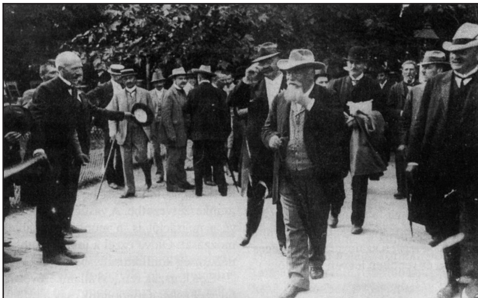
Darányi Ignác Palicsfürdőn a Magyar Gazdaszövetség évi közgyűlésén, 1909. június 23.

A kontinens központi vidékeinek mintájára ekkor jelenik meg Európa peremvidékén – Svédországban és Magyarországon is – a parasztpolgár típusa. Darányi – erről vallanak beszédei – erről a parasztpolgárról álmodozott. Ez a parasztpolgár már vállalkozó. Modernizálja a termelési folyamatot, tudatosan választja meg termékeit, követi a piac igényeit. Gazdasága több lábbon áll. Az állattartásban egyensúly van a hús- és a tejtermelés, a takarmányozással az állattenyésztés és a növénytermesztés között. Képezi magát. Vezeti a birtokról a számadást. Maga értékesít, kereskedik. Megbecsült partnere a felvásárló-nagykereskedőnek. De a családtagok ott vannak a helyi kispiacokon is. Darányi, mint láthatuk, földbirtok-politikával, parcellázással, telepítéssel kísérletezett, hogy segítse őket. De még jelentősebbek reformjai a mezőgazdasági hitel megteremtése területén. A vállalkozáshoz pénz kell, ezért szervezik meg állami ösztönzéssel az Országos Hitelszövetkezeti Központot, amely állami pénzt pumpált a mezőgazdaságba, mégpedig rögzített kamatokkal. Ezzel egy évtized alatt kihúzták a talajt a kis- és közép-parasztok legnagyobb réme, a falusi uzsorás alól. A pénz- és hitelgazdálkodás általános előretörése nyomán erősödik a bérlemények súlya. Ami szín-