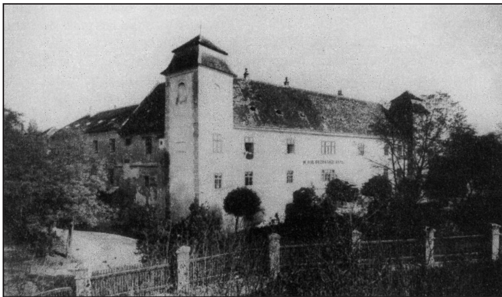
A mosonmagyaróvári gazdasági akadémia épülete

A felemlített kezdeményezések körében a politikai értelemben vett agráriusok érdekének látszottak. De hát mi is a politika, ha nem más, mint a társadalomban jelenlévő különböző érdekcsoportok megnyilvánulási területe? (Ahogy ez, reményeink szerint, a mai magyar demokráciában is ki fog alakulni.) Márpedig ez a szülőföldvédelem, szállásterület-karbantartás a profitorientált tőkétől nemigen várható el . És ez nem a tőke hibája. Ezt felesleges történelmileg a történészeknek, jele-