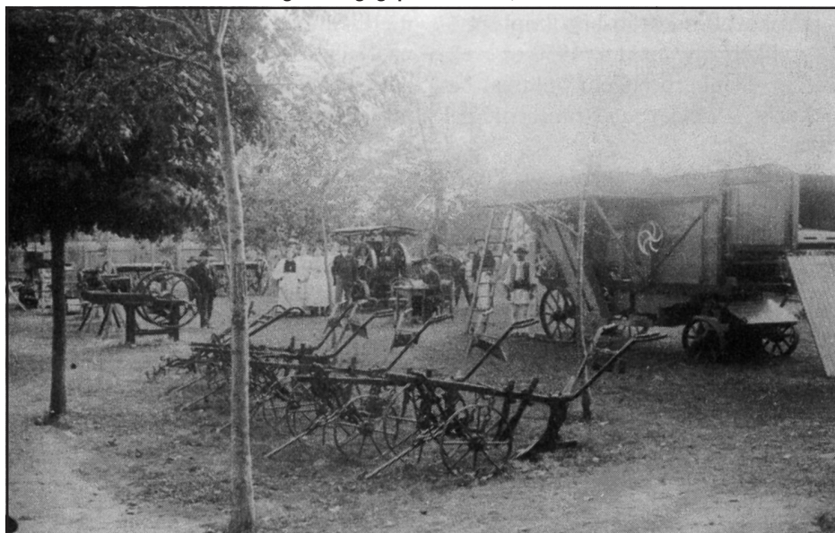
Mezőgazdasági gépek kiállítása, 1900 körül

Vagyis kevés egyszerűen azt mondani, hogy az „állam szerepet vállal”. Konkrétan kell megvizsgálni: a társadalom működésének mely területe kívánja az állami szerepvállalást. És milyen formában: vállalkozásösztönző vagy a – szerintem kevésbé hatékony – segély formájában. Én ma is azon a véleményen vagyok, hogy az állami szerepvállalás nem feltétlenül antiliberális. A társadalom működésének bizonyos szféráját nem lehet a tőkére bízni. A tőkének – ahogy ezt korábban is említettem – nem ez a feladata. (Sokan ezt nem veszik tudomásul és ezért szidják a tőkét.) Úgy látom – lehet, hogy rosszul –: a századfordulón Darányiék arra használták az államot, amire az való: a szolgáltatások fejlesztésére, munkaerőképzésre és közérdekű feladatok szabályozására . A konzervatív reform e programja igenis korszerű volt. (Más kérdés, hogy ez a program a későbbiekben már kevésnek bizonyult az agrárium feszítő konfliktusainak feloldására.) A szolgáltató államra azonban szükség volt és van. Működése nemcsak a 19–20. század fordulóján volt az ország rendben tartásának az alapfeltétele, hanem ma is az. És ezt a szolgáltató, karbantartó szervezetet meg kell finanszírozni. Darányiék legnagyobb gondja is ez volt: megtalálni a megfelelő adópolitikát, hogy környezetünk rendben tartását, az infrastruktúra-fejlesztést lehetővé tegyék az ország egész területén.