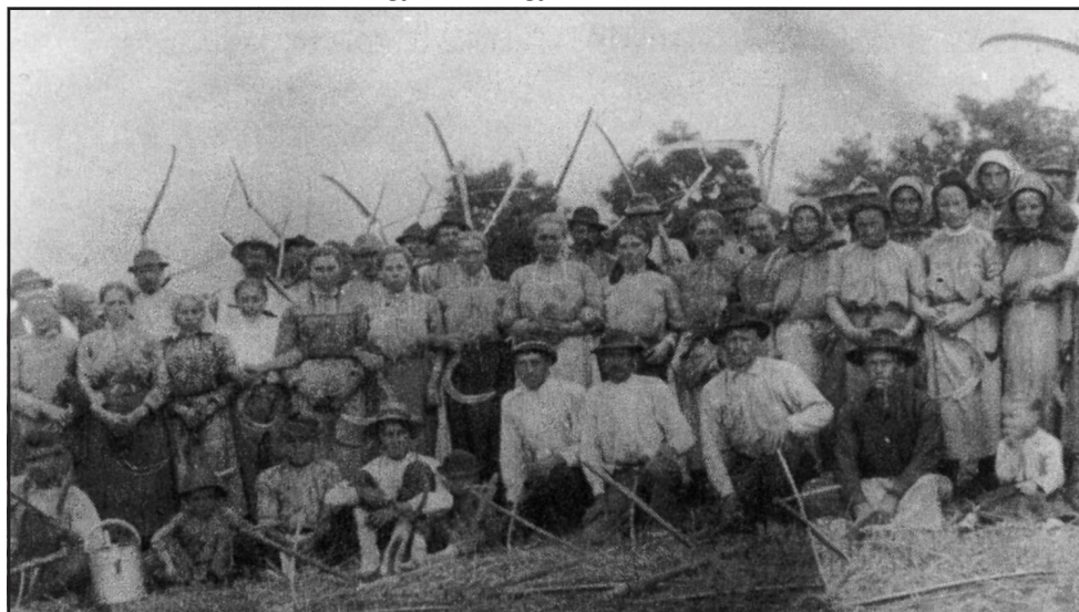
Aratók egy Tolna megyei birtokon, 1910 körül

A mezőgazdasági munkanélküliség Európa peremvidékén megoldatlan volt a korban. Ennek következménye a kivándorlás Európa peremvidékeiről: Írországból, Norvégiából, Svédországból Amerikába. Ezen országok után a Kárpát-medence a legnagyobb „kibocsátó”. Különösen a magyar állam