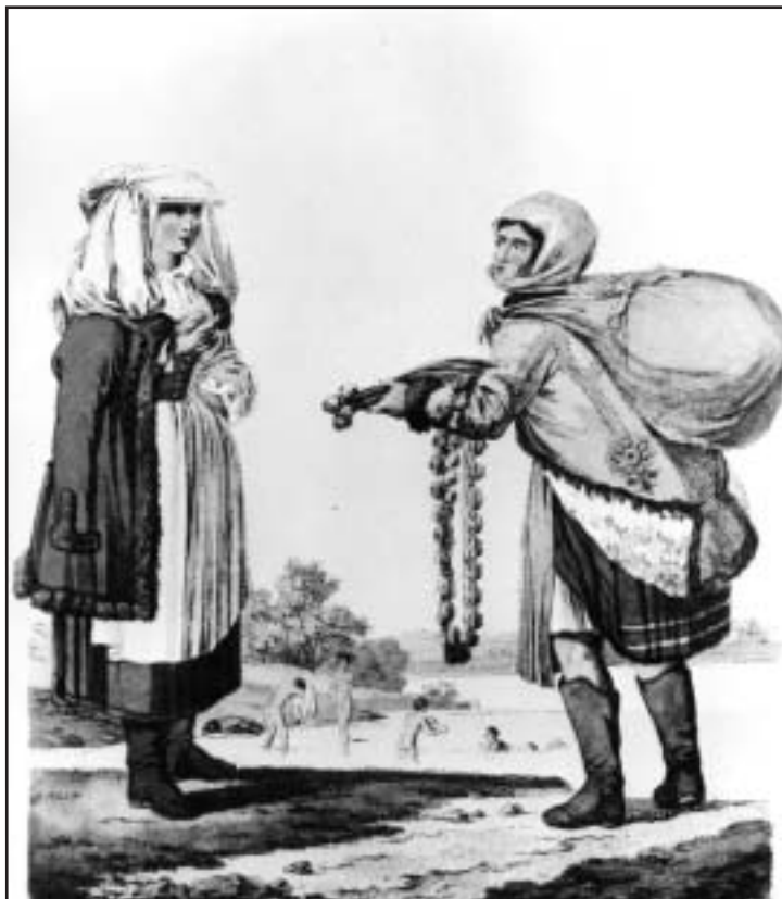
Piacra menő asszonyok, 19. század eleje

A térképeken elbeszélte történelem a történet szemléleti váltás sürgetője is kíván lenni.