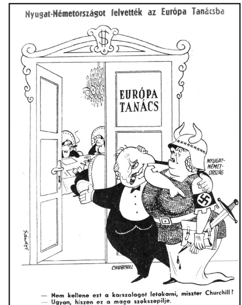
Karikatúra, Ludas Matyi, 1949. november 24.

az egyes kiadásokat a másik nyakába varrni és a felelősségvállalást elutasítani. És én ma is ezt látom mind a német, mind a magyar nemzeti fejlődés történeti perspektívájának: az egyén, az egyéniség kölcsönös tisztelőtén felépülő közösség kifejlődését. A fasizmus és a sztálini kommunizmus igazi meghaladása csakis ezen a alapon történhet. Én ezt tanultam meg ebben a teljesen liberális intézetben, és azóta sem látom másként a német és magyar fasizmust. S hogy milyen erősek az emberben a fiatalkori élmények? Amikor mint miniszternek a szememre vetették, hogy túl erős befolyást biztosítok a német nyelvnek, a német kultúrának Magyarországon, Mainzra gondolva választottam az újságíróknak: uraim, az Önök gondolkodásában Németország talán még a fasizmus hazája, de az én gondolkodásomban a liberális demokrácia, a szociálliberális egyik otthona. És egy magamfajta liberális értelmiségit több szál köt az én hasonlóan gondolkodó mainzi, müncheni barátaimhoz, mint saját hazám letűnt és jelenkori kisdiktátoraihoz.